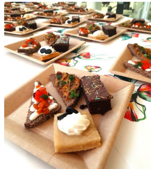
Kuva: Koulutuksen työelämäpäivä1/2024