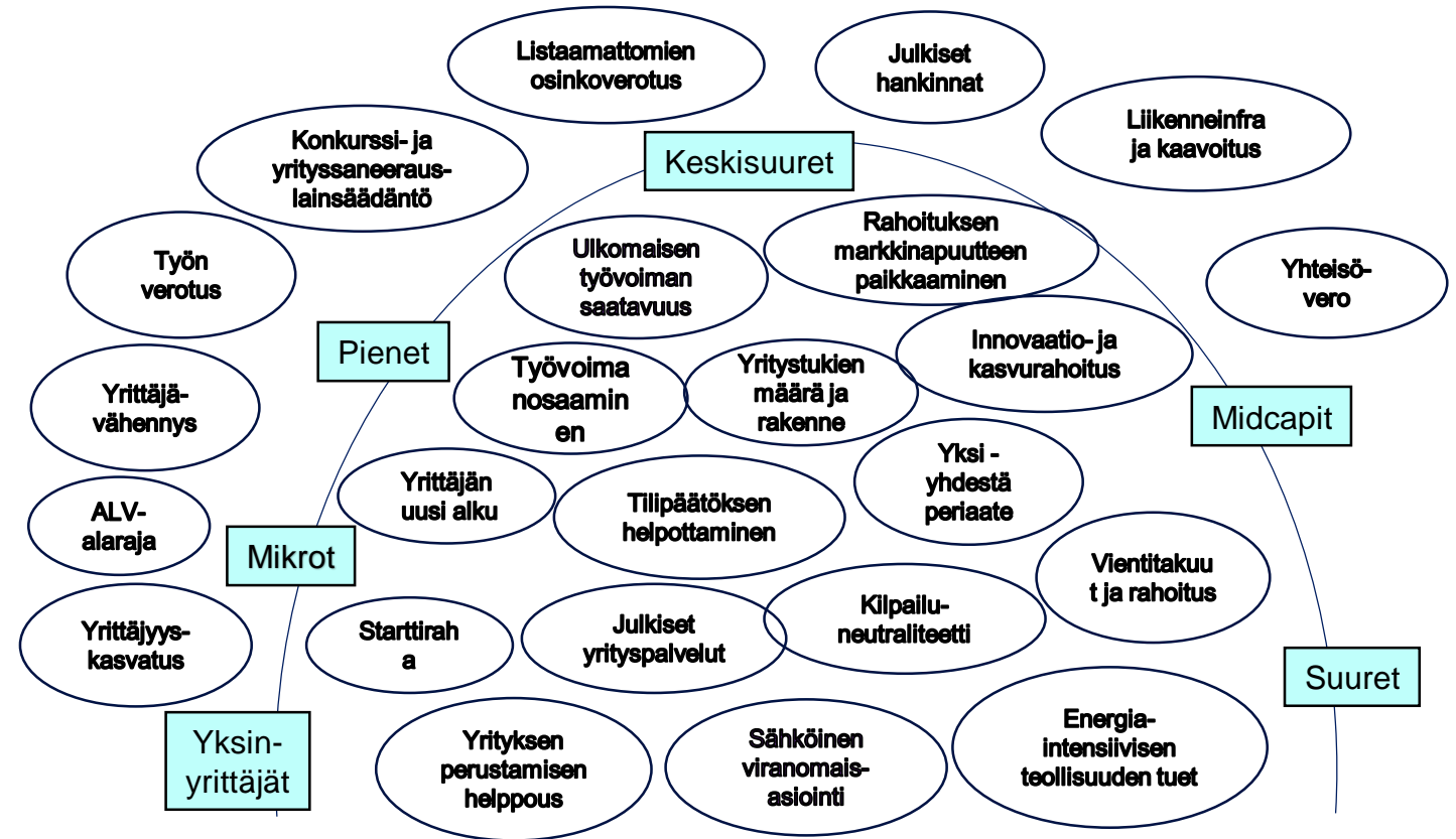
Elinkeinopolitiikan osa-alueiden ja toimien hahmottelua yritysten kokoluokittain